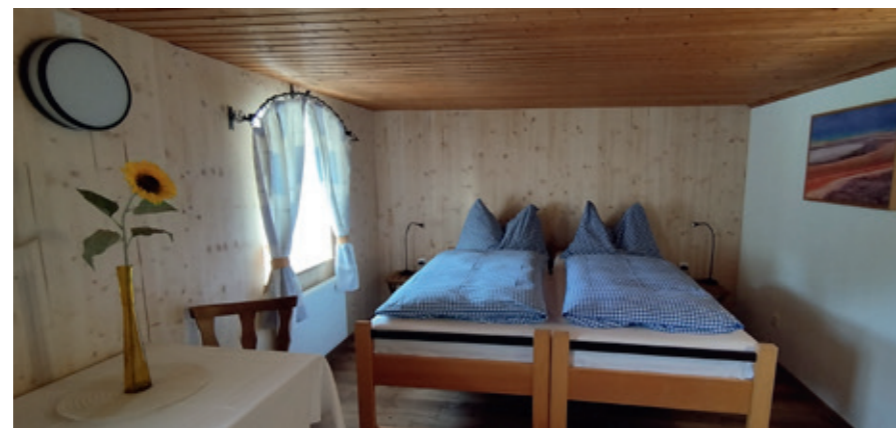
▲ Eines der 6 renovierten Zweibettzimmer

Baumpflanzaktion 2023 ▶ 120 Laub- und Nadelbäume, verschiedene Sorten