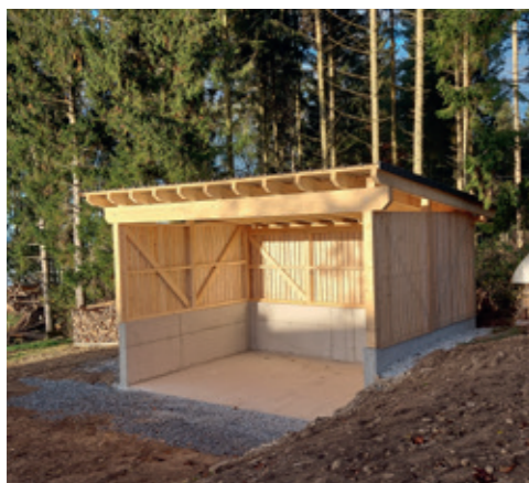
▲ Errichtung Hackschnitzelunterstand im Herbst 2024

Aus dem alten Öltankraum entstand eine moderne Heizzentrale, in der unser Holzraster der jährlichen Durchforstung von 18 Hektar Eigenwald auf umweltfreundliche Weise thermisch genutzt werden kann.