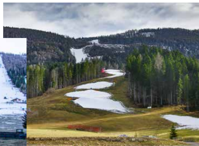
Schneearme Winter häufen sich, Skisport ohne künstliche Beschneigung ist heute weitgehendst unmöglich