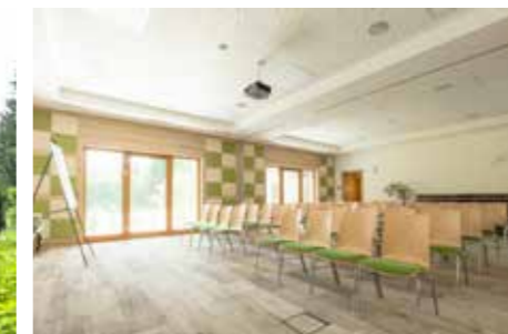
Foto groß: Eingangsbereich zum Seminarzubau Foto links unten: Aussichtsterrasse Rückseite Foto rechts unten: Teilbare Seminarräume mit bis zu 50 Plätzen