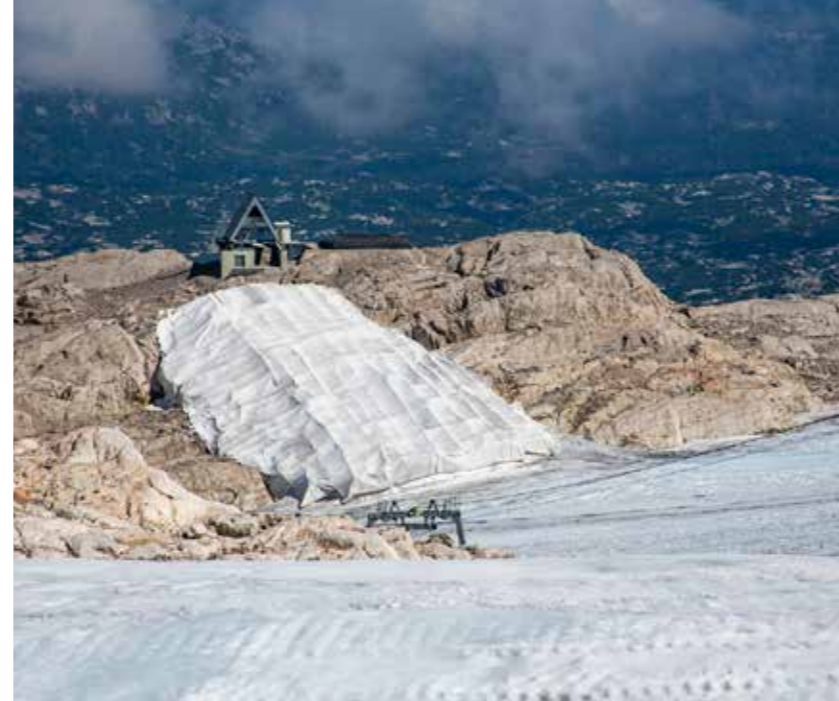
Dramatischer Eisverlust am Dachstein-Gletscher

Auch dem Hallstätter Gletscher am Dachstein kann man zusehen, wie er von Jahr zu Jahr schwindet.