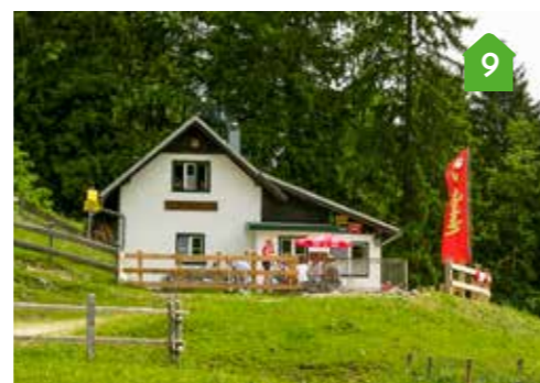
Stallburgalm der OG Weyer