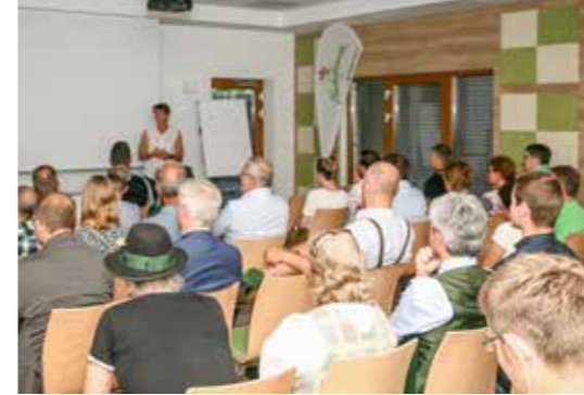
Grußworte der LAbg. Sabine Promberger an die 50 Gäste

- unter Einbindung aller Randgruppen -, attraktive und zeitgemäße Freizeitaktivitäten sowie der schonende Umgang mit der Natur und Umwelt. Das und noch vieles mehr wollen wir im Jubiläumsjahr 2020 im Rahmen verschiedenster Veranstaltungen in Oberösterreich und darüber hinaus feiern.